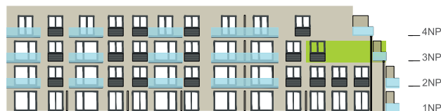
Východní pohled na dům / Building View - east side